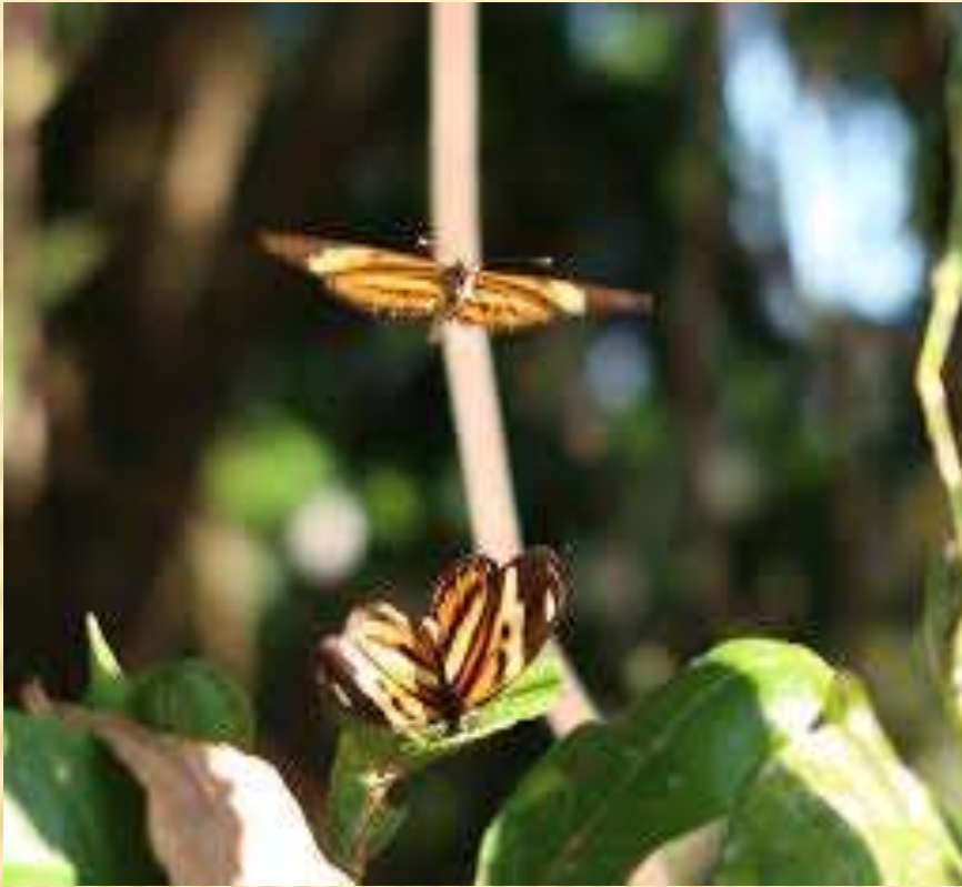
AS BORBOLETAS COLORIDAS