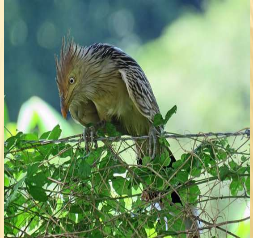
O PÁSSARO ARREPIADO