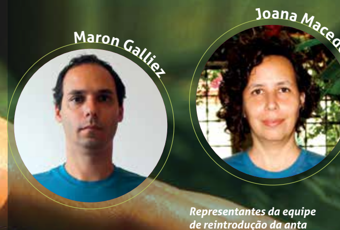
Representantes da equipe de reintrodução da anta